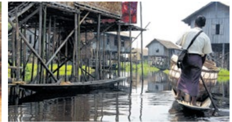
Foto's, van links naar rechts: Monnik in het klooster. Vrouw met vissen op de markt in Yangon. Typen op straat. In de bergen. Inle Lake, leven op het water.